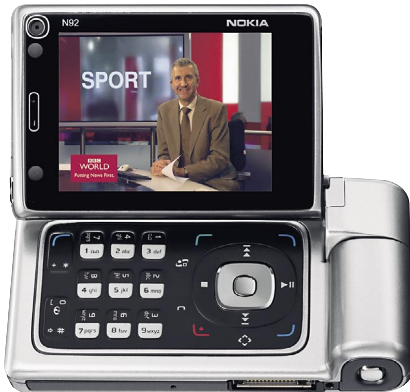
TV für unterwegs: das Nokia N92

tere ist zur Zeit voll im Gange. Je nach Unternehmensphilosophie stellen die einzelnen Unternehmen im Grundangebot Digitalpaletten zusammen, die sie entweder unverschlüsselt oder mit einer sogenannten Grundverschlüsselung versehen verbreiten. Für den Empfang von digitalen Programmen muss zwischen die Kabeldose und den Fernseher die sogenannte Set-Top-Box geschaltet werden. Sie dekomprimiert die zur effizienten Übermittlung nach dem Standard MPEG2 komprimierten digitalen Signale und setzt sie so um, dass sie auf dem analogen TV-Gerät dargestellt werden können.