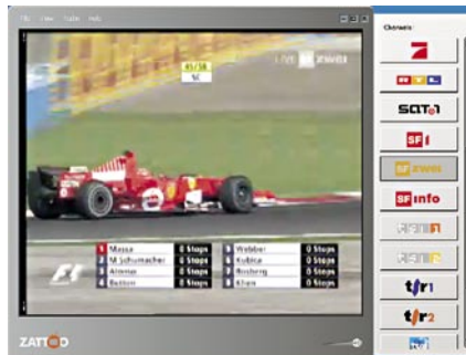
IPTV: Zattoo bietet über 40 Sender zum Nulltarif

Am bekanntesten in der Schweiz ist das schweizerisch-amerikanische Produkt Zattoo. Es wurde bislang ausschliesslich in der Schweiz getestet und ist frei erhältlich ( www.zattoo.com ). Bei Zattoo kommt die Fernsehübertragung nicht von einem zentralen Server, sondern es wird über ein Peer-to-Peer-Netz von Nutzer zu Nutzer weitergegeben. Allerdings kann hier im engeren Sinne der Definition nicht von IPTV gesprochen werden, da über das Internet übertragene Streams weder bei der Qualität und der Sicherheit noch bei der Zuverlässigkeit ein garantiertes Mass gewährleisten können. Trotzdem werden aber solche P2P-Angebote immer belieb-